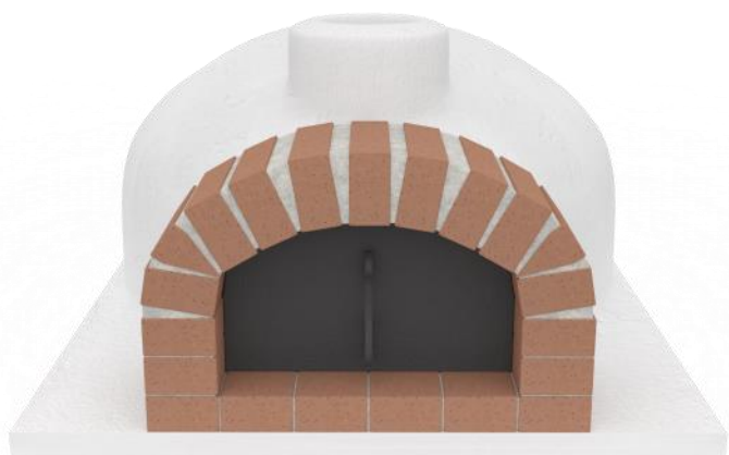
Piec Wojtek standard